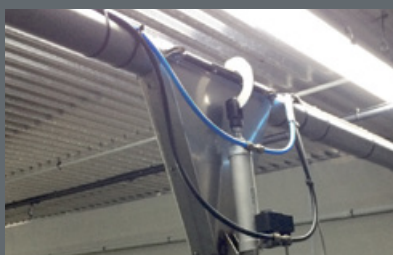
URUCHAMIANY ZAWÓR NA ŁAŃCUCHACH PODAJNIKÓW