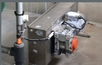
JEDNOSTKA NAPĘDOWA NA POCZĄTKU AUTOMATYZACJI OPTIMAT