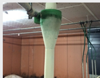
CYKLON PODAJĄCY PASZĘ DO KORYT