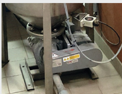
SYSTEM PNEUMATYCZNYCH DMUCHAW I ZAWORÓW NA POCZĄTKU UKŁADU AUTOMATYZACJI OPTIMAT