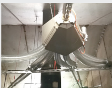
PNEUMATYCZNY SYSTEM PRZEKIEROWANIA W POMIĘSZCZENIACH