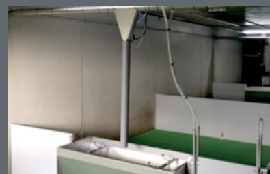
DYSTRYBUCJA SUCHA W POMIĘSZCZENIACH Z DYSKIEM ŁAŃCUCHA